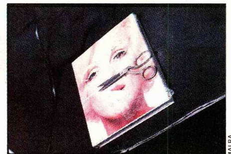
La Marilyn de Oiticica , parte de la serie "Cosmococas".