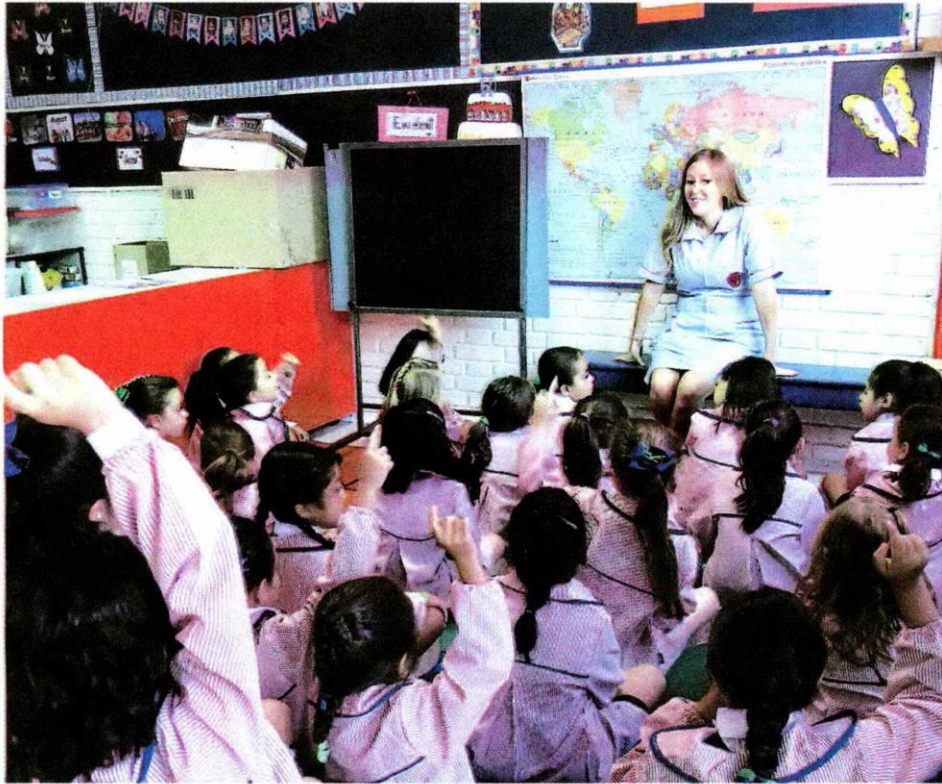
▶▶ Alumnos del Colegio del Sagrado Corazón, donde hasta ahora solo asisten niñas.