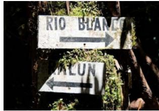
LETREROS. Aunque la huella es visible y relativamente fácil de seguir, el sendero tiene muy poca señalética.