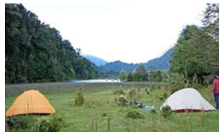
ESCALA. Si bien hay algunos campings establecidos, en rigor se puede parar en cualquier parte. Aquí, en la laguna Los Palos.