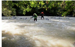
AVANCE. Aparte de la lluvia y el barro, otra dificultad es el cruce de algunos ríos que pueden venir crecidos, como el Blanco.