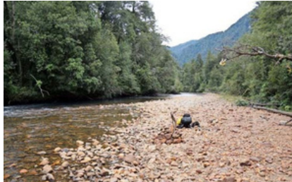
NATURALEZA. La laguna Los Palos y el río Conchas, dos locaciones en el tramo chileno. La ruta tiene unos 70 kilómetros que se recorren entre 5 a 7 días. La época para hacerla es en el verano, cuando llueve menos y hay control fronterizo.